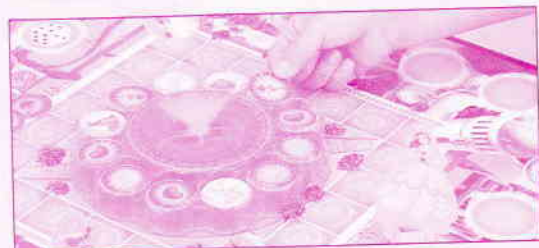
Schéma 3 Le jeu peut commencer !