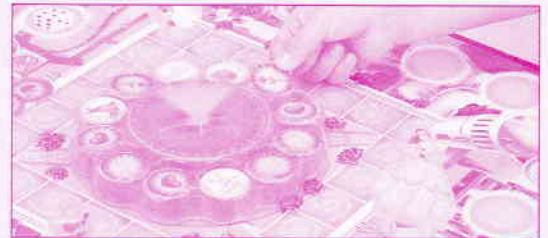
Abbildung 3: Und los geht's!