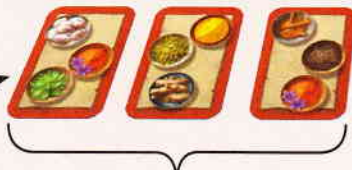
Auslage der Gerichte bei 4 Spielern