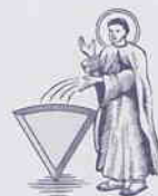
Case « Raccourci »

Lorsque vous vous arrêtez sur une de ces cases, rendez-vous directement à la case Quartier Général de Catégorie de la même couleur. Si vous répondez correctement à la question qui vous est posée, vous gagnez le triangle marqueur.